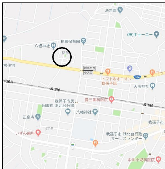
※このハウジングマップは概要紹介図です。図面と現況が異なる場合は現況優先となります